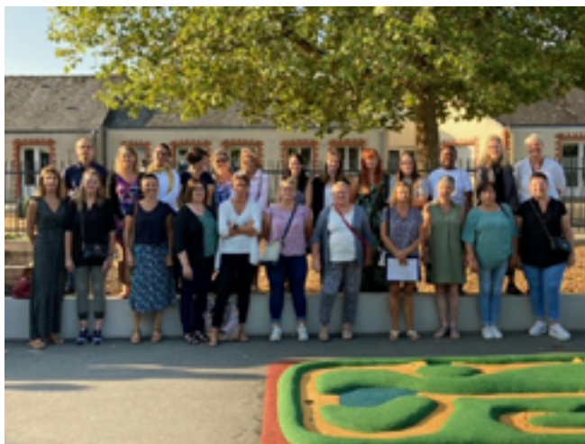
L'équipe de l'école Marie Curie

Les agents municipaux ont participé à la réunion de rentrée fin août, l'occasion pour eux de prendre connaissance des dernières informations afin de les aider dans leurs missions au quotidien.