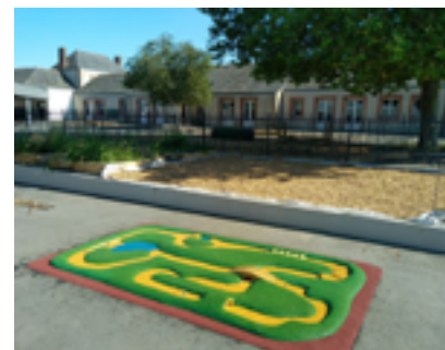
Dès la rentrée les élèves ont pu profiter des nouvelles installations dans leur cour!

Pour remédier à cela la cour va être aménagée en « cour Oasis ». Les travaux vont s'étaler sur deux années.