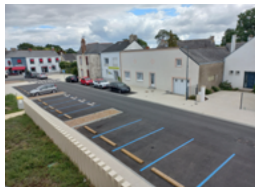
Places de stationnement rue Saint Jean

N'oubliez pas de mettre votre disque bleu de manière visible sur le tableau de bord de votre véhicule.