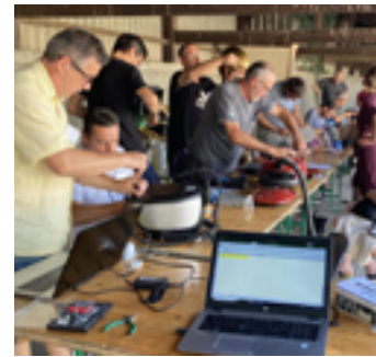
Franc succès pour l'atelier du Repair Café en juin dernier

Le premier atelier Repair café s'est tenu sur notre commune samedi 18 juin. Divers objets ont été apportés : appareils électroménagers, outils de jardinage, lampes, jouets mécaniques ou électroniques.