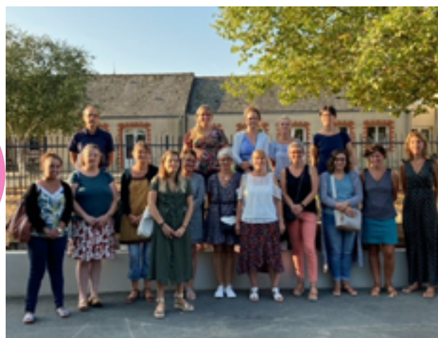
L'équipe de l'école Jean Monnet